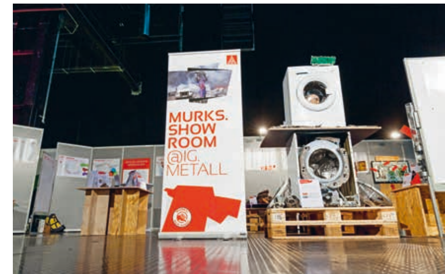
Kleine Ausstellung, große Aufregung: der Murks-Showroom

Eigentlich wollte Schridde Pädagoge werden. Nach dem Abitur zog er von Hannover nach Freiburg, um Sprachen und Ge-